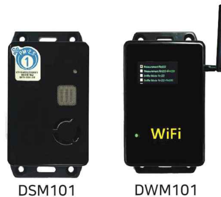
DSM101의 옵션세트인 DWM101 (디스플레이&와이파이 통신모듈)