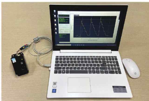
사업자의 시스템에 연결하거나 데모프로그램을 이용하여 측정값 확인